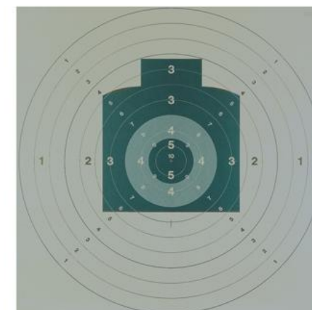
B10 / B5